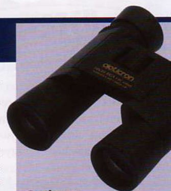
Opticron BGA T PC Oasis 10x28 Forstørrelse: 10x Frontlinse- diameter: 28 Nærgrense: 2,9 m Synsfelt 1000 m: 86 m Mål: 106x99 mm Vekt: 260 gram Pris: Kr 2895,- Forhan- ler: Kikkertspesialisten (tlf. 72 88 48 00) www.kikkertspesialisten.no