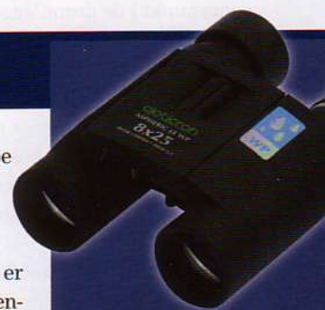
Opticron Aspheric LE WP 8x25 Forstørrelse: 8x Frontlinse- diameter: 25 mm Nærgrens- 2 m Synsfelt 1000 m: 105 m Mål (L/B): 110x95 mm Vekt: Pris: Kr 1495,- Forhan- ler: Kikkertspesialisten (tlf. 72 88 48 00) www.kikkertspesialisten.no