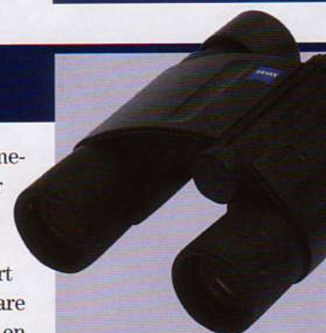
Zeiss Victory 10x25 T Compact Forstørrelse: 10x Frontlinse- diameter: 25 mm Nærgrens- 110x106 mm Vekt: 245 gram m Synsfelt 1000 m: 95 m Pris: Kr 4490,- Forhandler: Carl Zeiss AS (tlf. 23 17 23 9) www.zeiss.no